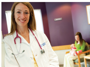
REFERIDOS PARA EL CUDADO DE SALUD & PROGRAMAS COMUNITARIOS

La amplia variedad de recursos y beneficios de nutrición de WIC están disponibles empezando en el embarazo y continuando hasta que su hijo cumpla 5 años.