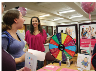
EDUCACIÓN SOBRE NUTRICIÓN