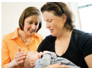
APOYO EN LA LACTANCIA